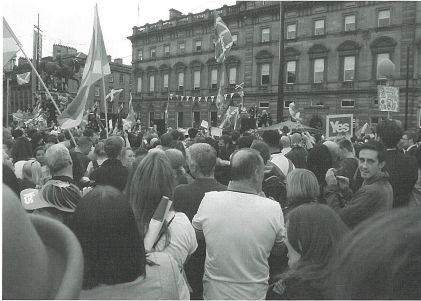
投票日前日グラスゴー中心部に集まる独立賛成の人々

地方分権改革とは別に、小泉政権以降、さまざまな特区方式による改革が進められてきた。構造改革特区は、国が個別の地方自治体や民間事業者に対して特例的な規制緩和を認め、さらには成功事例を全国展開させることによって、地域経済の活性化を図ることを目的として2002年から実施された。ところが、東京市政調査会による調査では、当初は国・地方の関心も高く、多くの提案が出され、実現した事例も多かったものの、次第に国による認定件数が低下するとともに、認定内容も先行事例をまねるものが増えていったことが指摘されている。地方自治体に対するアンケートでは、中央省庁からの回答には「はぐらかし」、「紋切型」、「現状維持」などの対応があったことが指摘されている(東京市政調査会研究室編2007)。その後、政権が変わっても、総合(国家戦略・地域活性化)特区、道州制特区法、沖縄振興特別措置法に基づく経済特区、東日本大震災復興特区、福島復興再生特別措置法による特区など、特区方式は多用されているものの、顕著な成果を見定めることは難しい。