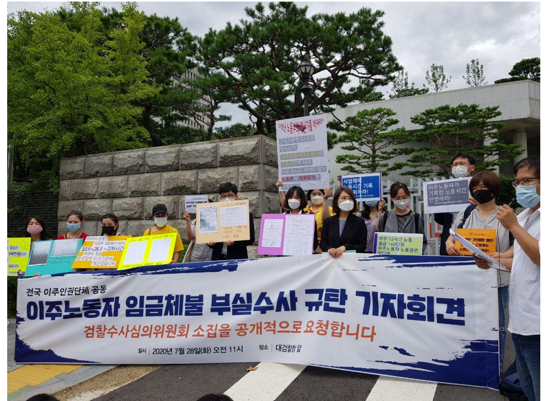
移住労働者賃金未払い手抜き捜査糾弾記者会見