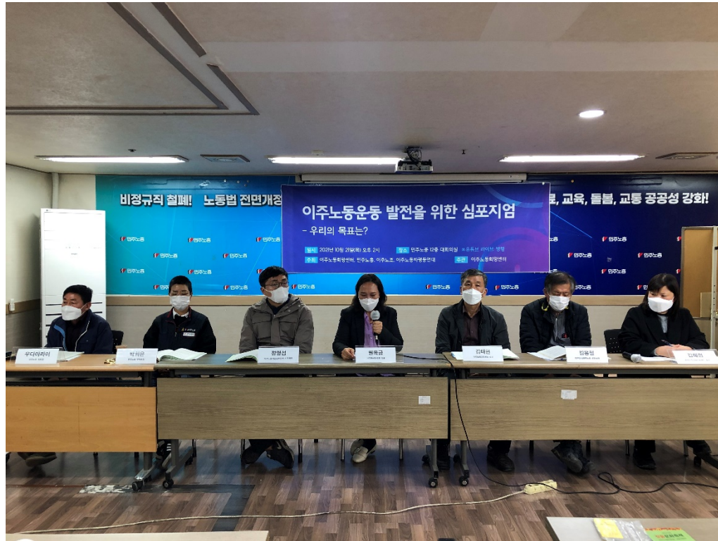
2021年11月21日 移住労働運動発展のためのシンポジウム主催及び主管