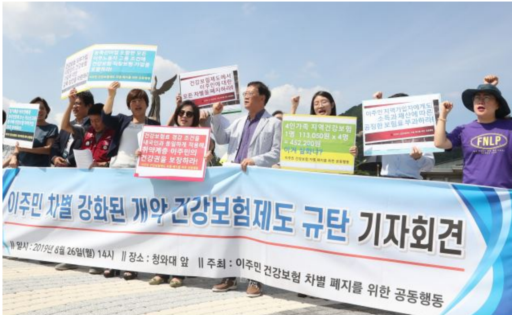
移住民差別が強化された改悪健康保険制度への糾弾記者会見