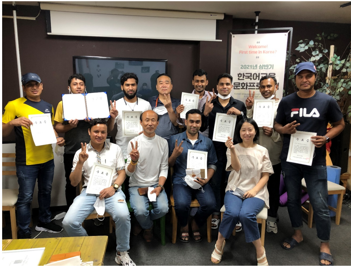
2021年移住労働者韓国語文化教室 上・下半期各12週間で計21名の移住労働者が修了